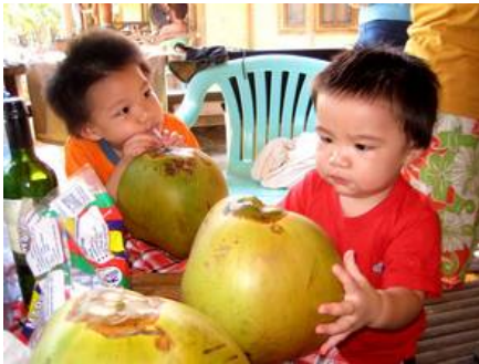
Kids and Buco Delight © Eva Lizares Si-Coruña